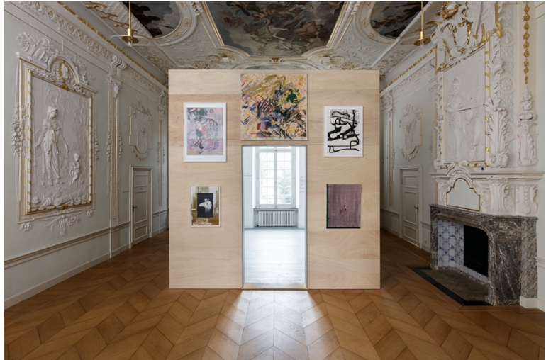
Installationsansicht Kaisersaal im Kunsthau NRW mit Werken von (im Uhrzeigersinn) Martin Kippenberger, Markus Oehlen, Sigmar Polke, Albert Oehlen, Georg Herold