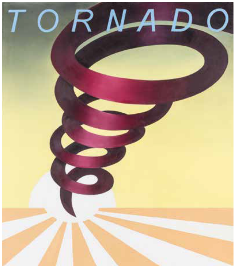
Angela Fette, TORNADO , 2019, Öl auf Leinwand, 120 x 105 cm; c: the artist, Foto: Carl Brunn