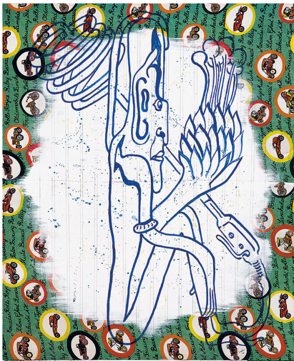
2 Sigmar Polke, Ohne Titel (Stoffbild), 1972, bedruckter Stoff mit Dispersionsfarbe, Acryl, 150×125 cm, [c] The Estate of Sigmar Polke, Cologne / VG Bild-Kunst, Bonn 2026, Foto: Anne Gold Download