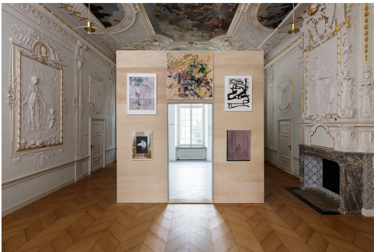
1 Installationsansicht Kaisersaal im Kunsthau s NRW mit Werken von (im Uhrzeigersinn) Martin Kippenberger, Markus Oehlen, Sigmar Polke, Albert Oehlen, Georg Herold Download

Melanie Weidemüller Leitung Presse & Kommunikation +49 (0)151 - 22 23 60 84 weidemueller@kunsthau s .nrw