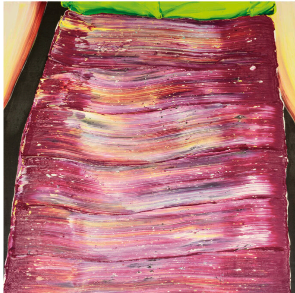
4 Cornelius Völker, Hände, 2002, Öl auf Leinwand, 160 × 240 cm, © VG Bild-Kunst, Bonn 2026 Download