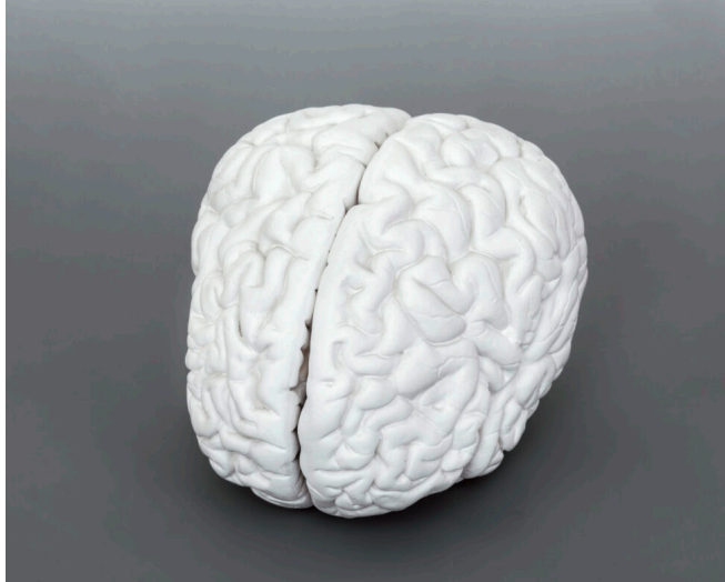
6 Katharina Fritsch, Gehirn, 1987/89, Gips, weiß gefasst, VG Bild-Kunst, Bonn 2026, Foto: Anne Gold