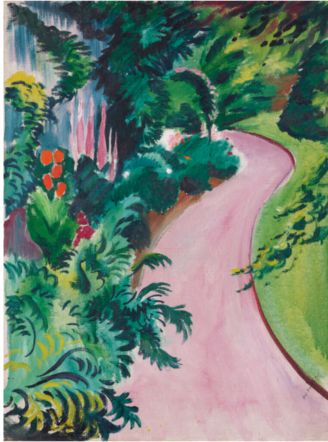
8 August Macke, Gartenweg, 1912, Öl auf Leinwand, 81 × 59 cm, © KNRW, Foto: LWL- Museum für Kunst und Kultur (Westfälisches Landesmuseum), Hanna Neander Download