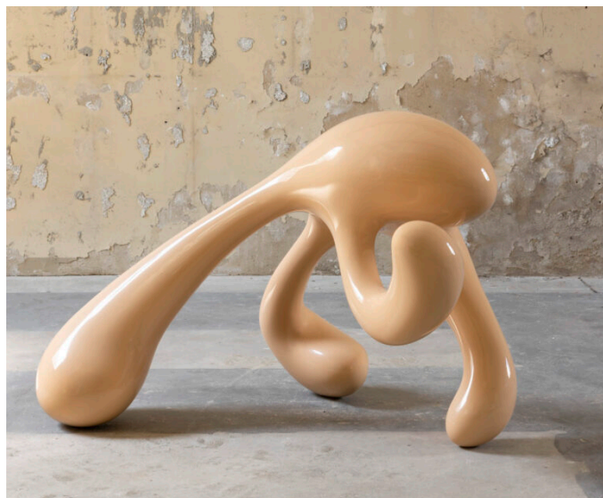
5 Thomas Rentmeister, Ohne Titel 1998, Polyester, 95 × 146 × 97 cm, © VG Bild-Kunst, Bonn 2026, Foto: Anne Gold Download