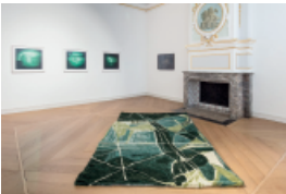
Installationsansicht mit Werken (v.l.n.r.) von Thomas Ruff, Vera Drebusch, Anna Vogel © VG Bild-Kunst, Bonn 2023/The Artists