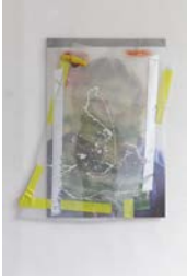
Isa Genzken, Ohne Titel , 2016, 93×75 cm, verschiedene Materialien © VG Bild-Kunst, Bonn 2023