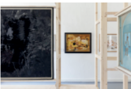
(l.) Gerhard Hoehme, Schwarzer Frühling , 1960 und Aufstrebendes Gelb/Zerspringendes Gelb , 1952, Öl auf Leinwand, (r.) Johannes Geccellic, Turner in der Halle , 1949, Öl auf Mehlsack © VG Bild-Kunst, Bonn 2023, Foto: Carl Brunn