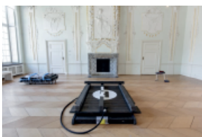
Johannes Wohnseifer, What has Bilderberg twodo with black helicopter? , 2002 u. 2023, variabel, Mixed Media © Wohnseifer