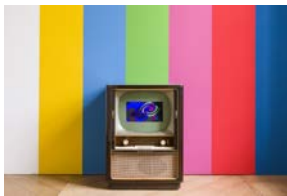
Nam June Paik, I Never Read Wittgenstein (I Never Understood Wittgenstein) , 1997, Wandmalerei, Video, TV-Monitor, Größe variable, © Nam June Paik-Estate