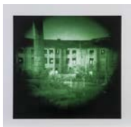
Thomas Ruff, Nächte , 1993, Granolithografie © VG Bild-Kunst, Bonn 2023, Foto: Anne Gold