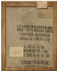
Johannes Geccelli, Turner in der Halle (Rückseite) , 1949, Öl auf Mehlsack, Ankauf 1952 © VG Bild-Kunst, Bonn 2023, Foto: Carl Brunn

Abdruck erlaubt im Zusammenhang mit der Berichterstattung zur Ausstellung und mit Nennung der nachfolgend angegebenen Bildrechte.