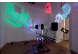
Amit Goffer, X marks the spot , 2019 und Thus I Cry , 2019, variabel, Mixed Media, Edelstahl, Eisen, Plexiglas, Holz, Elektronik, Licht © VG Bild-Kunst, Bonn 2023, Foto: Carl Brunn