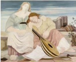
Eberhard Viegener, Die Trösterin , 1941, Öl auf Sperrholz