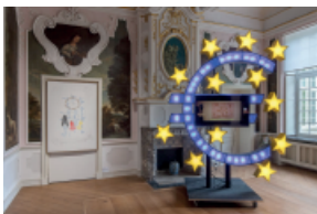
(l.) Alex Wissel, Ich ernähre mich durch Kraftvergeudung , 2018, Buntstift auf Papier, (r.) Alex Wissel und Jan Bonny, Euro-Zeichen (Rheingold) , seit 2016, Fiberboard, Acrylglas, Aluminium, Bildschirm, Video, Ton ©Wissel/Bonny, Foto: Carl Brunn